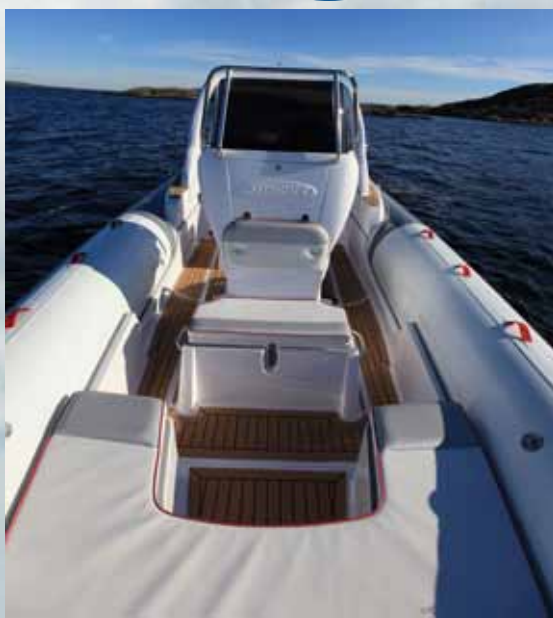
SOLBÅT: Diabloen har en stor solseng forut. Med illeggputer kan den utvides ytterligere.

A lve Marine i Tønsberg har startet import av de italienske Stingher-båtene. RIB-ene spesiallages i et utall av farger på pongtonger, puter og skrog fra fabrikken i Milano, Italia. Båten er en typisk dagsturbåt for en glad ungdomsgjeng, eller et råflott tilbehør til hytta.